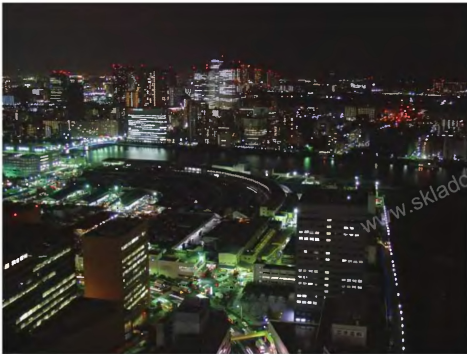
Ночной Токио. Вид с верхушки небоскреба — штаб-квартиры агентства Dentsu