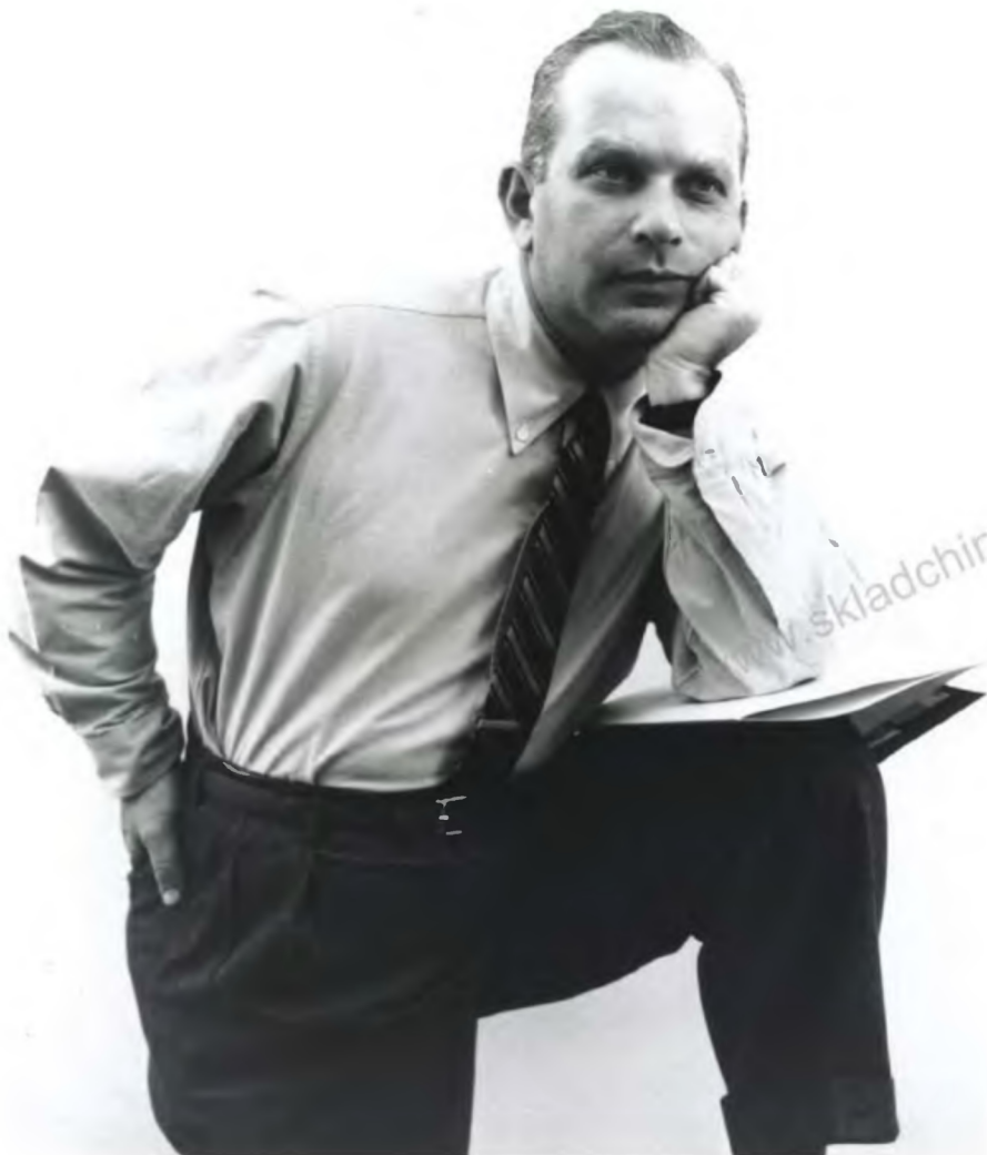
Билл Бернбах. Именно он совершил креативную революцию в рекламе