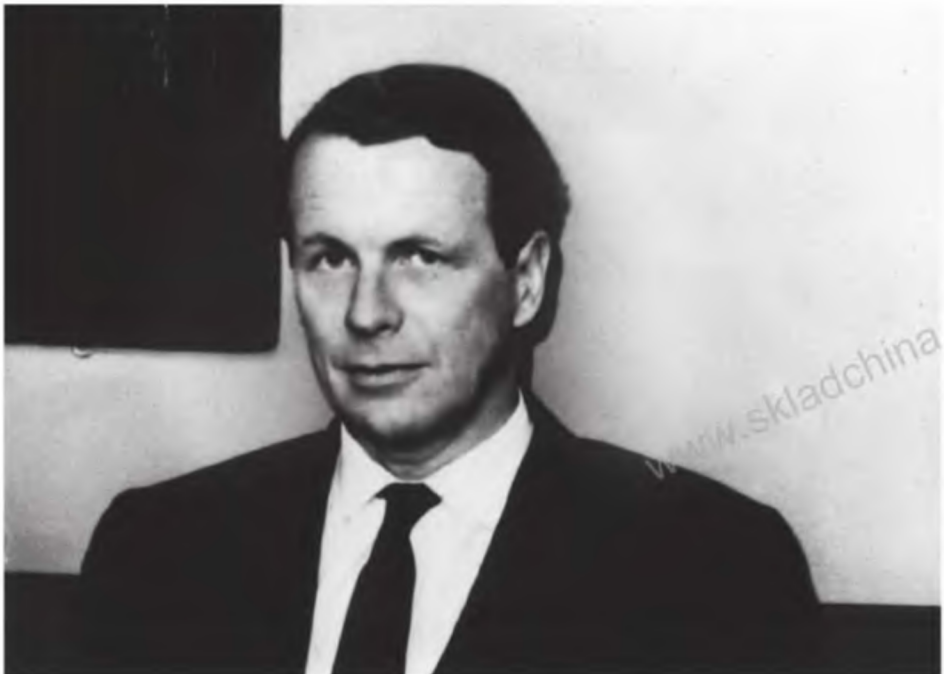
«Британское агентство в Нью-Йорке». Дэвид Огилви, 1950-е гг.

Печатается с разрешения Ogilvy & Mather.