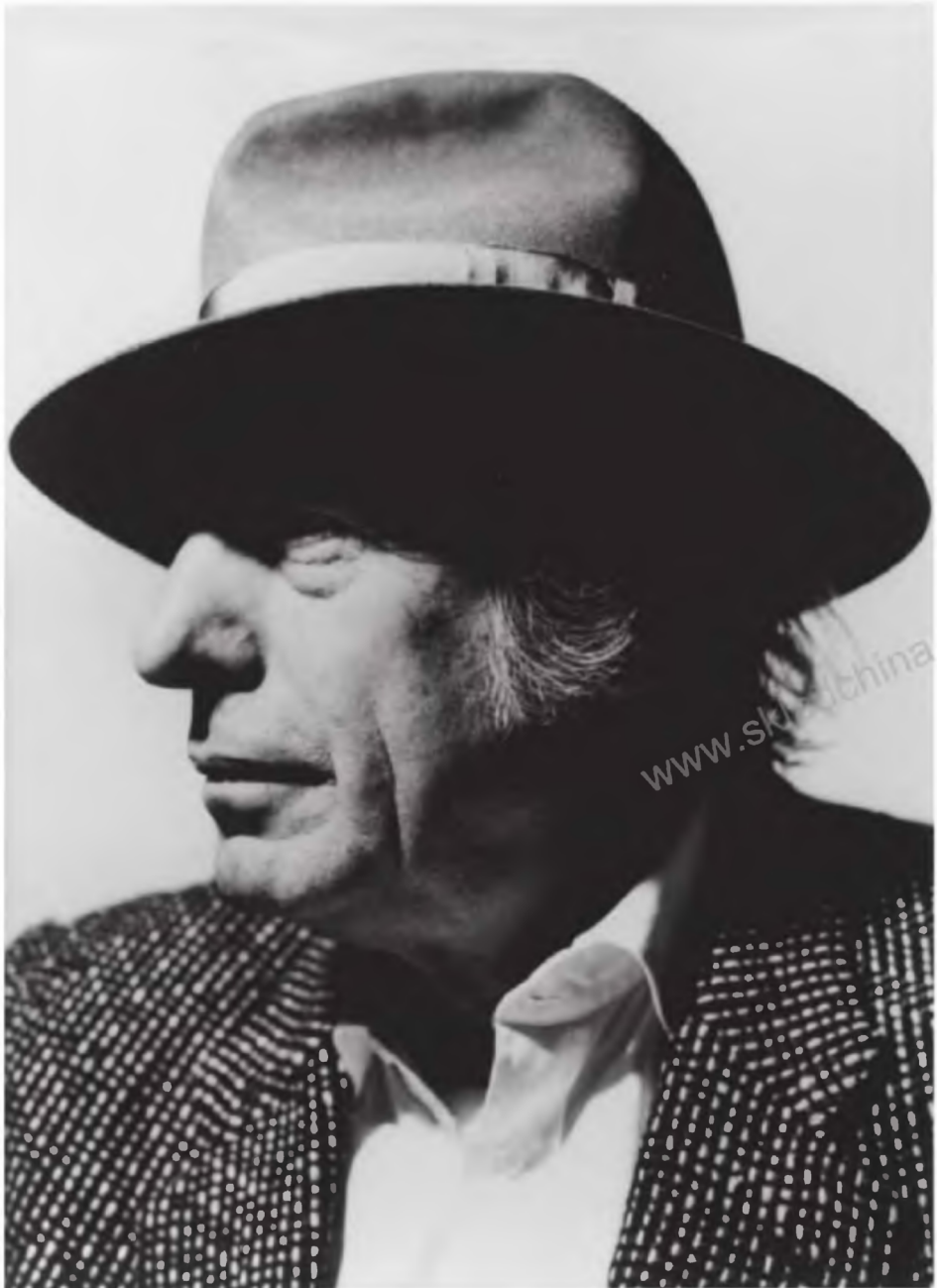
Армандо Теста — итальянский художник-график и гений рекламы

Печатается с разрешения правообладателей.