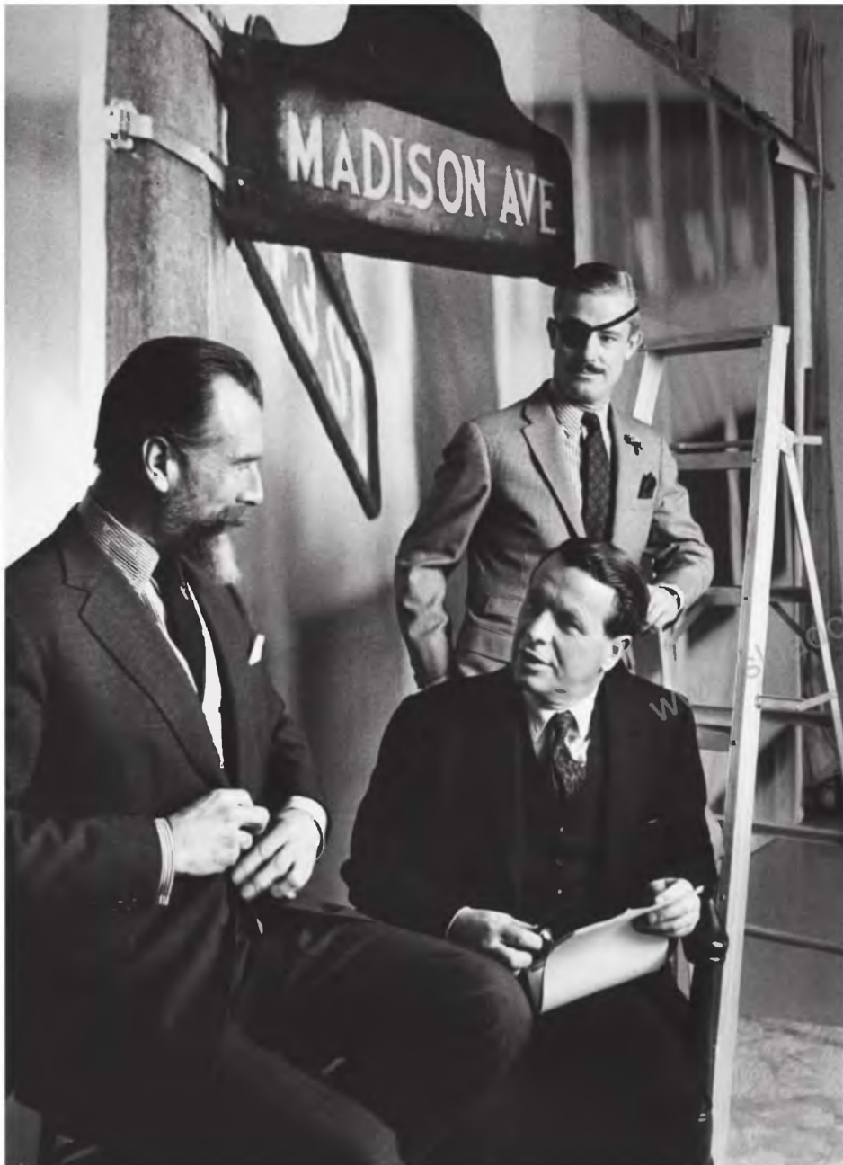
Дэвид Огилви с двумя созданными им «рекламными иконами»: Мужчиной в сорочке Hathaway и Эдвардом Уайтхедом — звездой рекламы напитка Schweppes

Печатается с разрешения Ogilvy & Mather и Hatheway & Schweppes.