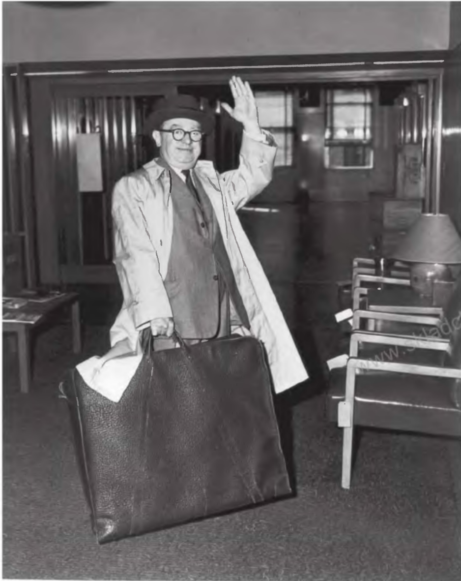
«Я знал, что могу делать рекламу лучше, чем кто-либо еще». Лео Барнетт со своим портфолио в руках