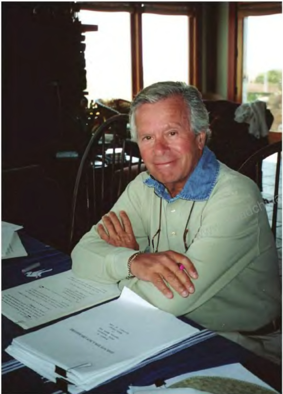
Креативная легенда агентства BBDO Фил Дасенберри — один из создателей современной рекламной индустрии