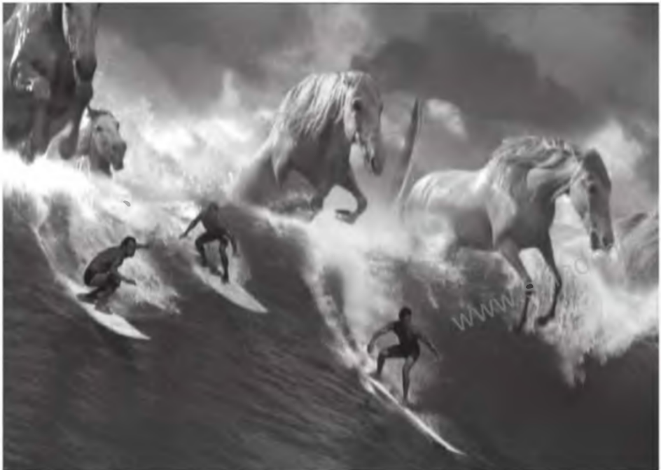
Знаменитая реклама пива Guinness под названием «Серферы», созданная агентством BBDO